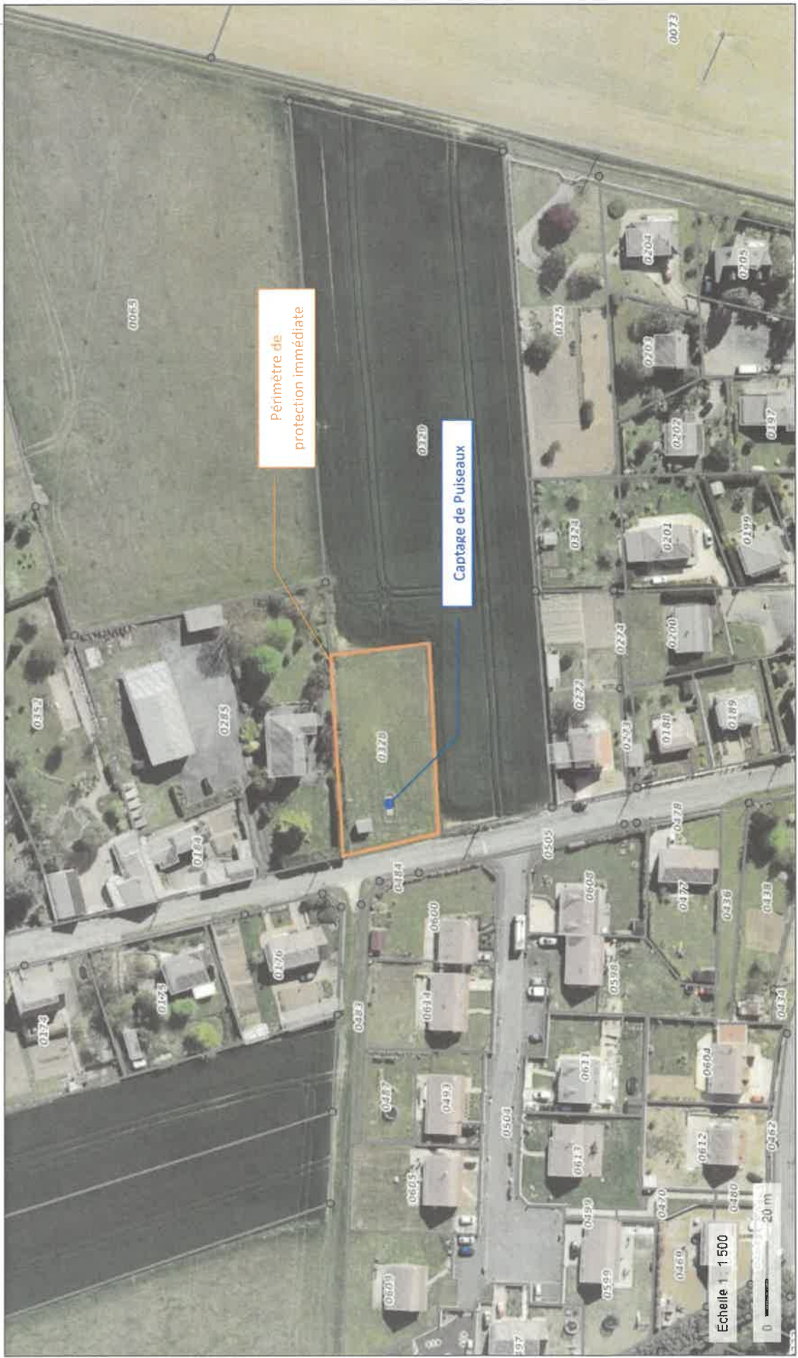
Plan de situation du captage de Puiseaux sur fond de plan cadastral (source : Géoportail – Août 2020)